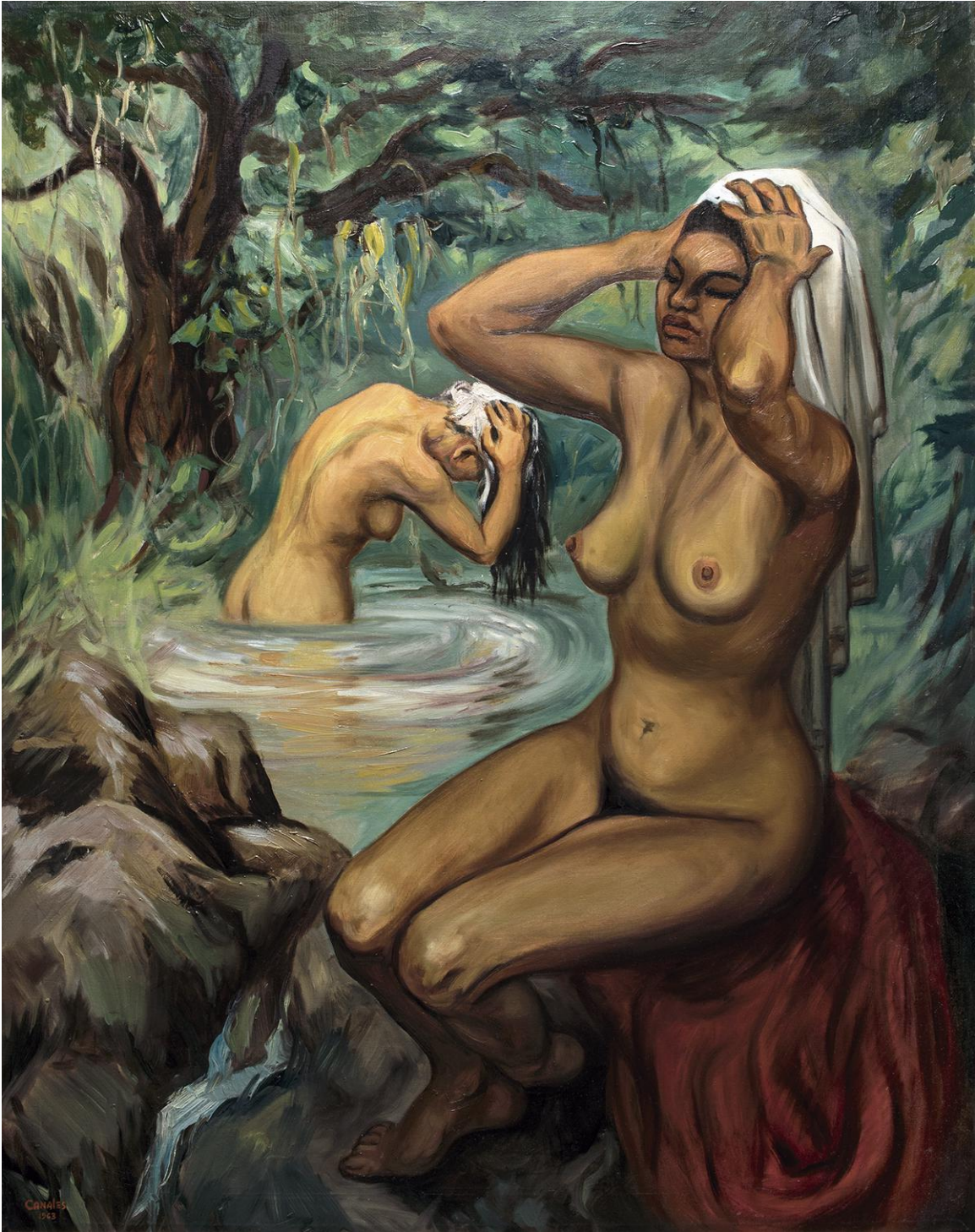
Álvaro Canales. Bañistas . 1963. Óleo sobre tela. Esta obra pertenece a la colección plástica del Banco Atlántida.