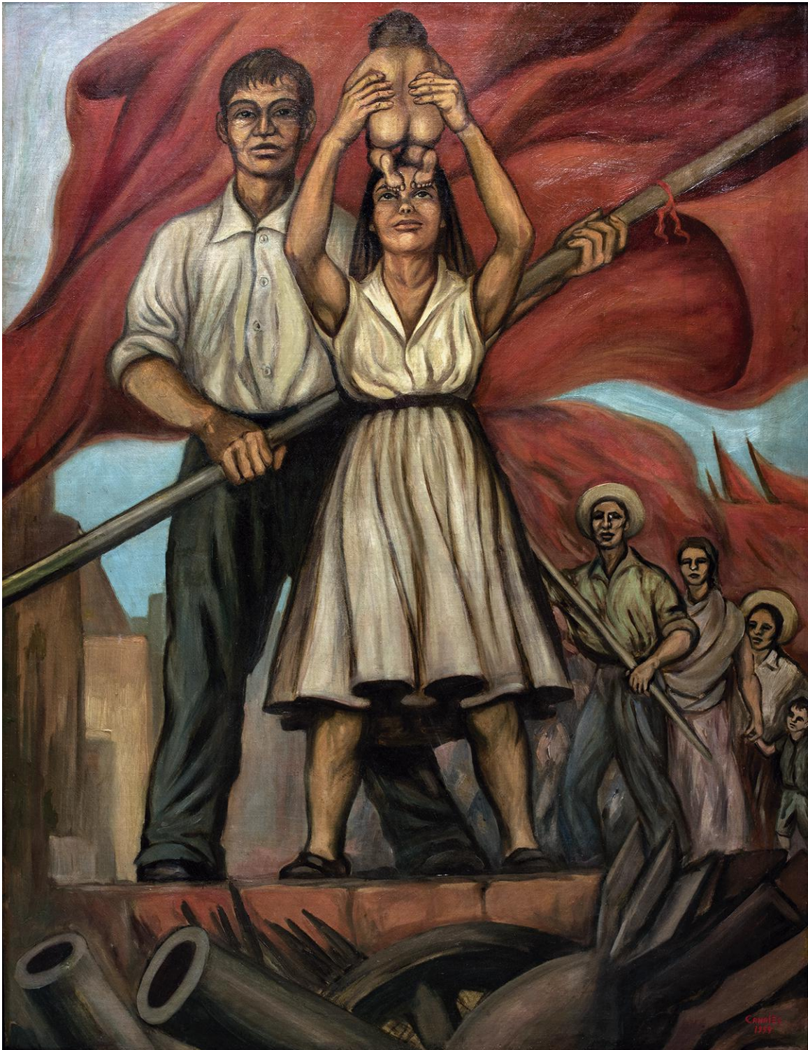
Álvaro Canales. Paz. 1959. Óleo sobre tela. A lo largo de toda su trayectoria artística, Canales representó siempre la figura humana tomando de modelo la fisonomía de la América indígena, su presencia es siempre inmanente en toda su producción plástica en donde ha quedado reflejada su problemática y las exigencias de la sociedad para resolverla. Esta obra pertenece a la colección plástica del Banco Atlántida.