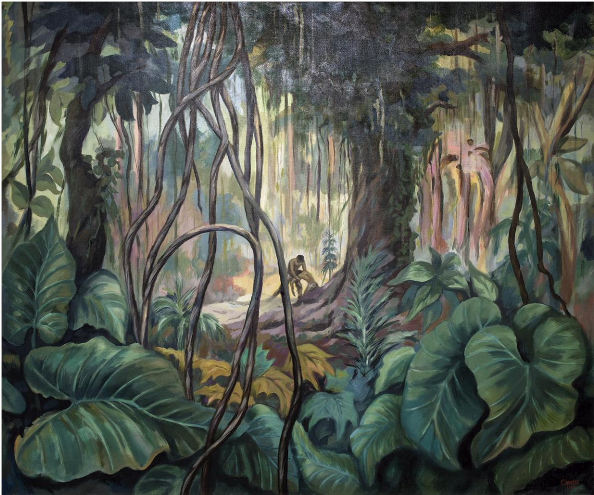
Álvaro Canales. Paisaje tropical . 1966. Óleo sobre tela. 150 x 125 cm. Esta obra pertenece a la colección plástica del Banco Atlántida. Fotografía por Paúl Martínez en formato digital 35mm, 2023

En el detalle de la obra Paisaje tropical a la derecha reproducido, vemos que más allá de la representación estética de un paisaje de nuestras tierras, el artista Canales ha dejado implícito un canto a la solidaridad humana en donde el hombre ayuda al hombre a erguirse y avanzar juntos en el exuberante trópico americano. Fotografía por Paúl Martínez en formato digital 35mm, 2023